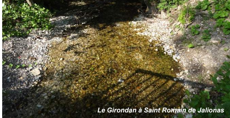
Le Girondan à Saint Romain de Jalionas

En tout état de cause, la fédération suit ce dossier avec grande attention afin de gérer au mieux cette problématique.