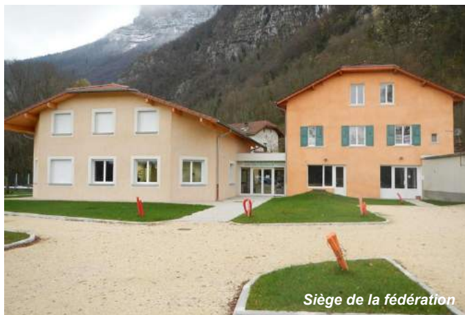
Siège de la fédération

Président de la fédération de pêche de l'Isère