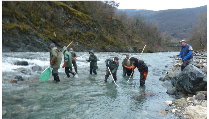
Pêche électrique de sauvetage réalisée par la Fédération avant l'arasement du seuil.