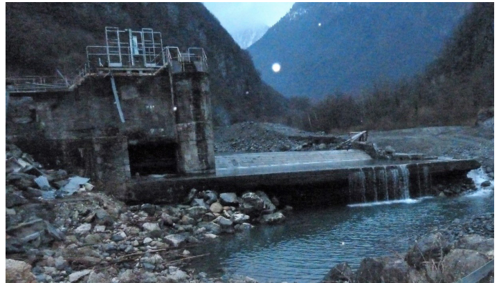
Le seuil de Séchilienne avant démantèlement