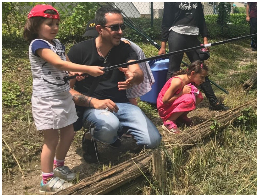
Fête de la Pêche à Veurey-Voroize

A l'image de l'an dernier, certaines AAPPMA ont organisé la Journée Nationale de la Pêche, manifestation conviviale et ouverte à tous.