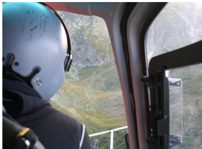
Pilote en approche d'un lac