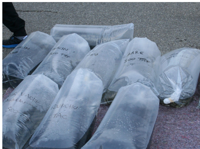
Sac d'alevins prêts à l'envoi

La Fédération remercie tous les bénévoles des AAPPMA, les salariés et les élus qui se sont mobilisés malgré une météo capricieuse.