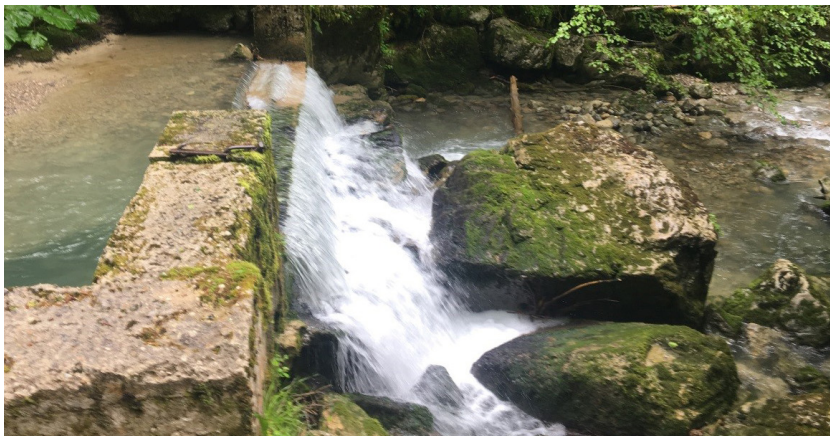
Seuil de la Fruitière

La Fédération de Pêche de l'Isère sera maître d'ouvrage, assistée dans sa tâche par l'Agence de l'eau, la Région et l'ensemble des acteurs locaux (PNR, AAPPMA St Laurent, Réciprocité Guiers). Les études avant travaux sont lancées, les aspects réglementaires sont en cours de traitement et d'analyses. Les travaux devraient commencer nous l'espérons en fin d'année.