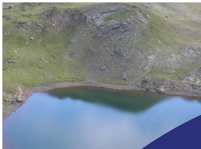
Lac en attente d'alevins