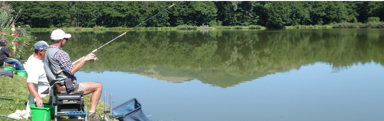
Equipe de participants et d'organiseurs