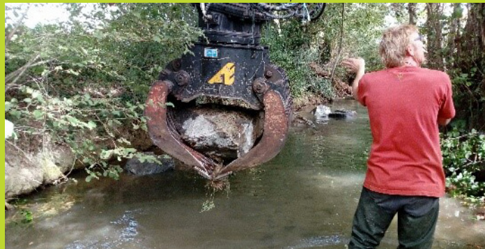
Pelle déposant un bloc dans le lit du cours d'eau

Une pêche de sauvetage sur le linéaire a été réalisée par la Fédération et l'AAPPMA avant les travaux.