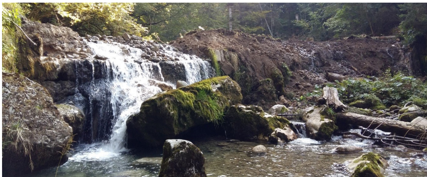
seuil de La laiterie en partie arasé

Traditionnellement, l'entente Guiers organise la fête du Guiers en juillet. Cette année, la manifestation revêtait un caractère particulier puisqu'en plus, le label «rivière sauvage» était décerné au Guiers mort, rivière emblématique du département de l'Isère.