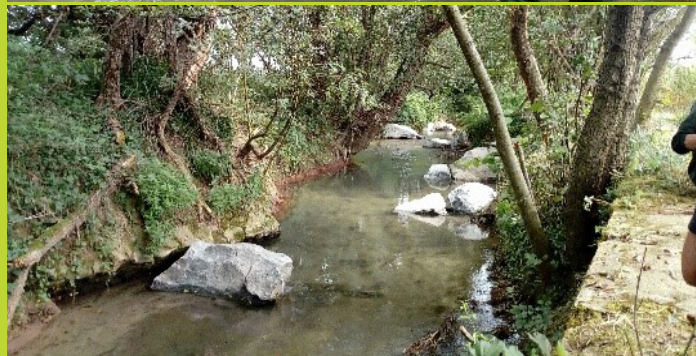
Blocs posés dans le lit du Barraton