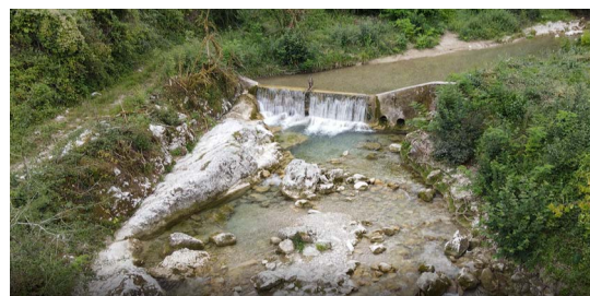
seuil des Rez sur la Drevenne avant travaux

C'est l'entreprise Mandier, ent locale qui a réalisé les travaux, le maître d'œuvre est la structure Eau et Territoires.