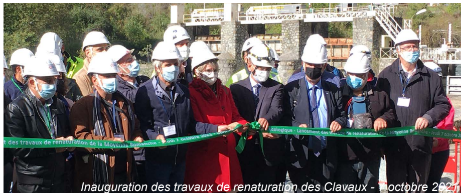
Inauguration des travaux de renaturation des Clavaux - Octobre 2021

La Romanche se dessine un nouvel équilibre, entre hydroélectricité et continuité écologique de la vallée.