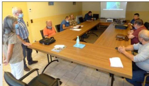
Réunion de bassin versant Sud Grésivaudan

Ces réunions, en comité restreint, permettent d'aborder divers sujets, moins généralistes qu'à la réunion des Présidents et plus ciblés aux regards des enjeux du secteur pour nos 68 AAPPMA.