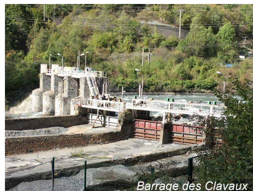
Barrage des Clavaux

Suite à la mise en service de la nouvelle centrale hydroélectrique de Gavet en 2020, cette nouvelle phase des travaux s'ouvre, répondant ainsi à :