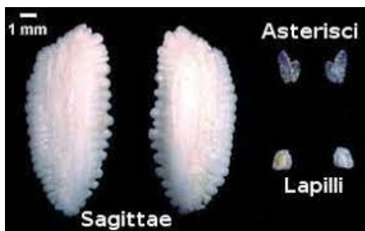
photo d'otolithes vu à la loupe binoculaire

Les poissons précédemment prélevés feront l'objet d'une extraction des otolithes (Sagittae) en laboratoire puis seront observés sous microscope UV (ultraviolet). La proportion d'individus marqués par station, nous renseignera sur l'efficacité d'alevinage. Un fort taux de poissons marqués sera indicateur d'une bonne efficacité d'alevinage et inversement. Les premiers résultats seront disponibles en fin d'année voir début 2022. Cette étude sera reconduite l'année prochaine auprès d'AAPPMA volontaires.