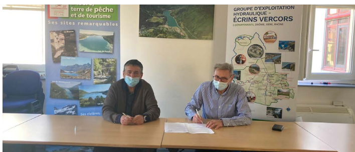
signature de la convention

+ d'informations sur le dépliant et le site internet de la Fédération de Pêche