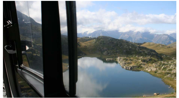
hélicoptère en lac d'altitude

Les Bénévoles des AAPPMA seront très tôt au bord de l'eau pour réceptionner les sacs de poissons sous oxygène pour les déverser conformément au plan d'alevinage fédéral. Dans Les espèces introduites il y aura des alevins de truite fario, d'arc en ciel ou de saumon de fontaine et probablement quelques Cristivomers. Les sacs seront préparés au niveau du