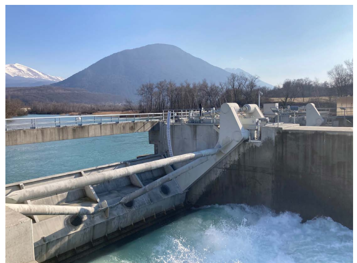
ouvrage du saut du Moine