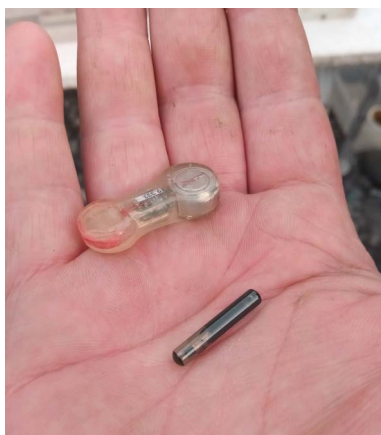
Matériel de marquage des truites sur la Romanche, Lignarre et Sarenne (émetteur radio et pit tag)